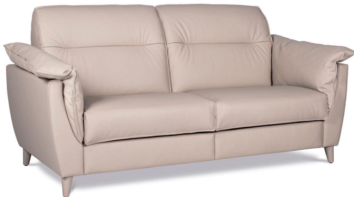
Canapé grand 2 places cuir Toledo Mastic