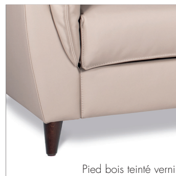
Pied bois teinté verni