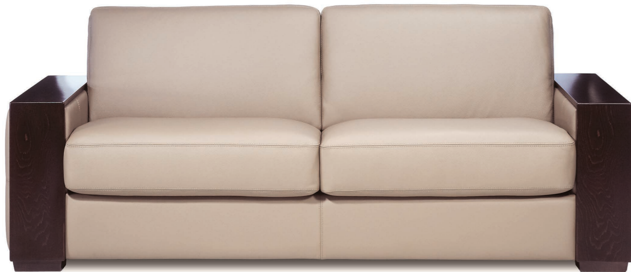
Canapé 3 places cuir Toledo Avorio