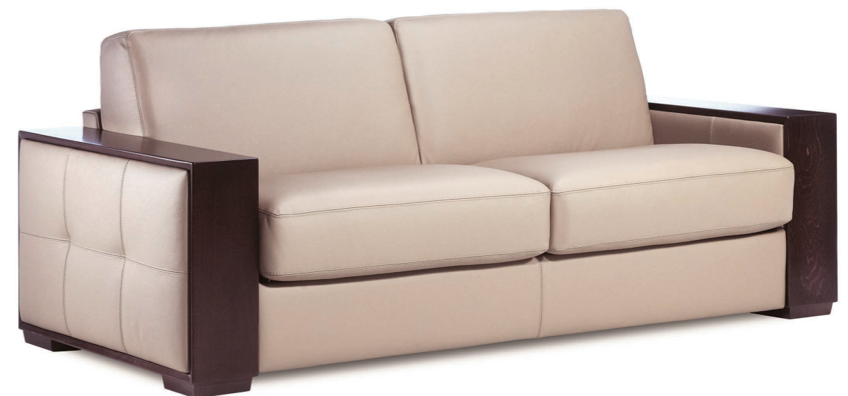
MADRID design Studio Neology